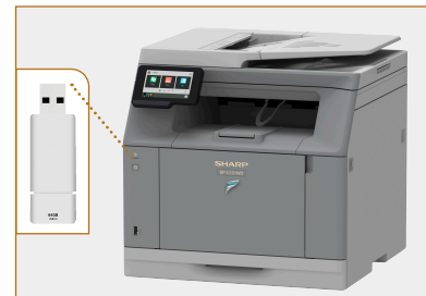
Port USB sur la façade pour brancher facilement les clés de mémoire.