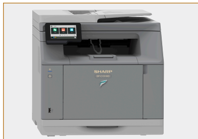
Configuration de bureau standard.