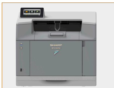
Configuration de bureau standard illustrée.