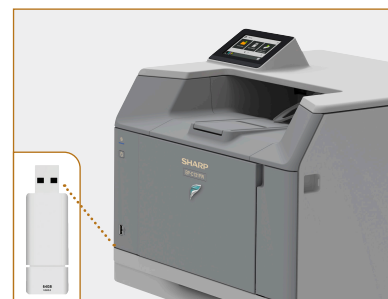
Port USB sur la façade pour brancher facilement les clés de mémoire.