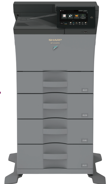
BPC545PW Imprimante couleur

Les tiroirs à papier chargent des formats jusqu'à 8,5" x 14" et des grammages de jusqu'à 220 gsm (page de couverture 80 lb). Toutes options comprises, la capacité de papier s'élève à 2 350 feuilles.