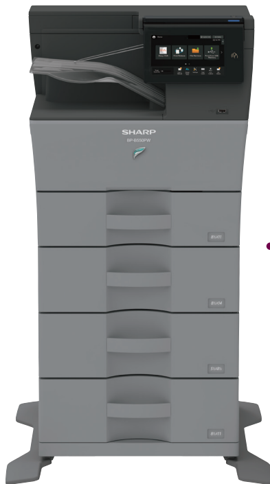
BPB550PW Imprimante monochrome

Des imprimantes polyvalentes faites pour renforcer la productivité.