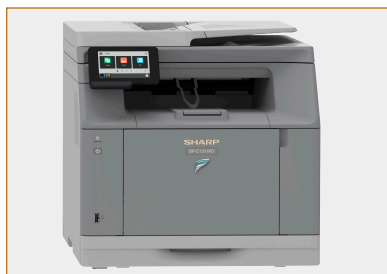
Configuration de bureau standard.