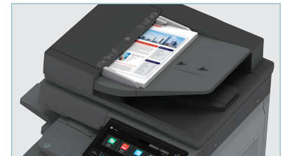
Le chargeur-inverseur 100 feuilles balaie les documents à une cadence de jusqu'à 80 images par minute.