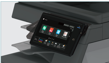
Le panneau de commandes bascule pour présenter un angle de vision optimal.