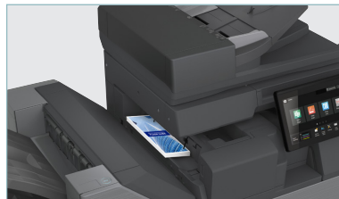
Le module de pliage interne en option propose une variété de profils de pliage, comme pli accordéon et pli roulé, entre autres.